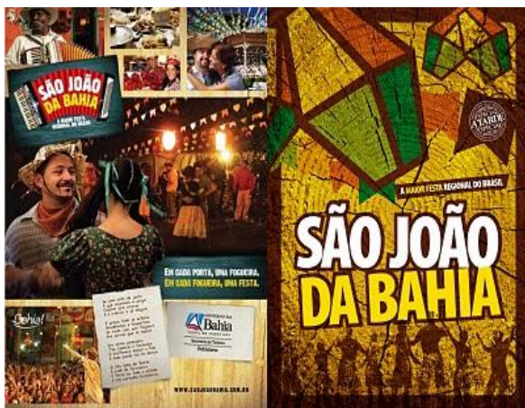
Figura 4: Revista São João da Bahia

Nos elementos que compõe todo o conjunto de campanha e que inclui a página da internet é possível observar a apropriação de elementos tradicionais tão característicos da festa de São João, por um meio de comunicação tão representativo da pós-modernidade como a internet. Se antes, o que podia ser considerado universo de uma vida rural como comidas típicas, superstições, receitas, agora passa a integrar uma linguagem urbana e divide o mesmo espaço com a venda de pacotes turísticos pela internet.