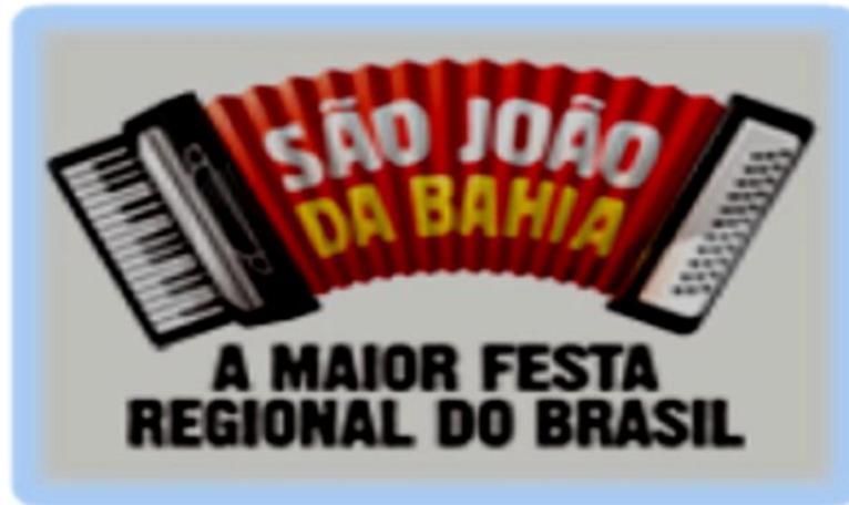
Figura 1: Logomarca do São João da Bahia

Segundo a Secretaria de Turismo 4 , o programa “...nasceu da necessidade de inovar as atrações turísticas da Bahia. Como a festa é realizada em quase todos os municípios baianos, a Setur e a Bahiatura optaram por formatar a festa como um produto turístico que desta forma pode ser comercializado pelas operadoras e agências de viagens” (2011). O ano de 2009 representou a concretização do programa, como pode ser visto na Tabela 1, já em 2010, o programa incluiu programação em Salvador e mais 245 municípios do interior 5 .