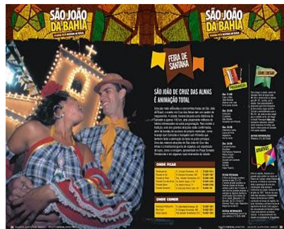
Figura 5: Revista São João da Bahia

Os elementos simbólicos das festas juninas como fogueiras, bandeirolas e quadrilhas integram todo o material promocional (Figuras 4/5) e passam por um processo de resignificação resultante da multiplicidade de sentidos presentes nesse conjunto