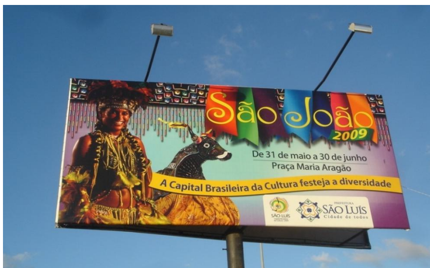
Fig. 1 - São João 2009 - Bumba meu boi. Prefeitura Municipal de São Luís.

Uma dessas identidades é a de São Luís como a cidade da festa do bumba-meu-boi. A festa, que no século XVIII sofria perseguição do poder, no final do século XX passa à condição de ícone de identidade maranhense, em função de um jogo de poderes que tem respaldo no turismo. A festa, como revela a imagem da brincante no outdoor abaixo, é hoje uma das marcas mais fortes da cultura popular maranhense, representando todo o processo de transformação de conceitos acerca do que seja cultura e patrimônio no estado e no mundo.