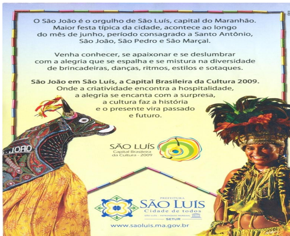
Fig. 3 - Folder turístico. São Luís, junho 2009. Governo do Maranhão.

No segundo e terceiro parágrafos, a enunciação estabelece diálogos com um discurso que constrói o nordeste como o lugar da festa, da alegria, das brincadeiras, da diversão, do lazer e do povo hospitaleiro. No terceiro parágrafo, o enunciador destaca o título recebido pela capital maranhense (Capital Brasileira da Cultura 2009), ressaltando-o, na materialidade linguística, por meio do recurso gráfico, o negrito.