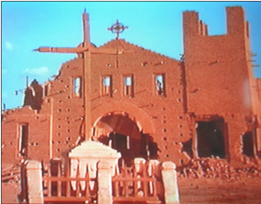
(Imagem 04) Igreja do Bom Jesus ou Igreja Nova reconstituída no filme Guerra de Canudos

Outro aspecto que chama a atenção, nessa obra, é o tratamento neo-gótico aplicado aos vãos das portas e janelas laterais do pavimento térreo transformadas em barricadas, em oposição às janelas de apelo mudéjar, indicando a transição no construir do Conselheiro. (Imagem 05).