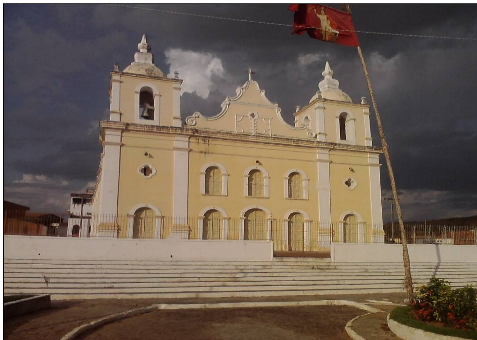
(Imagem 07) Igreja de São João, Geremoabo - BA

Autoria: Apôlonio de Todi, século XVIII.