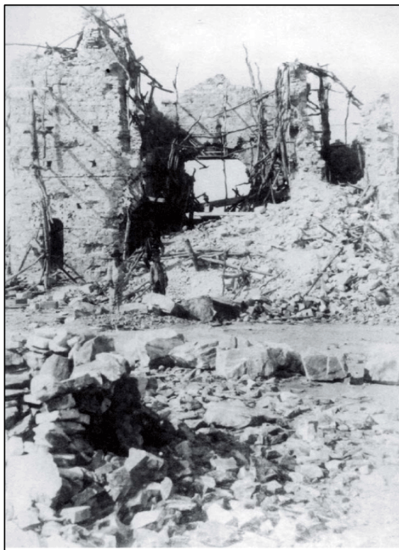
Imagem 02: Fachada da Igreja do Bom Jesus ou Igreja Nova - Belo Monte