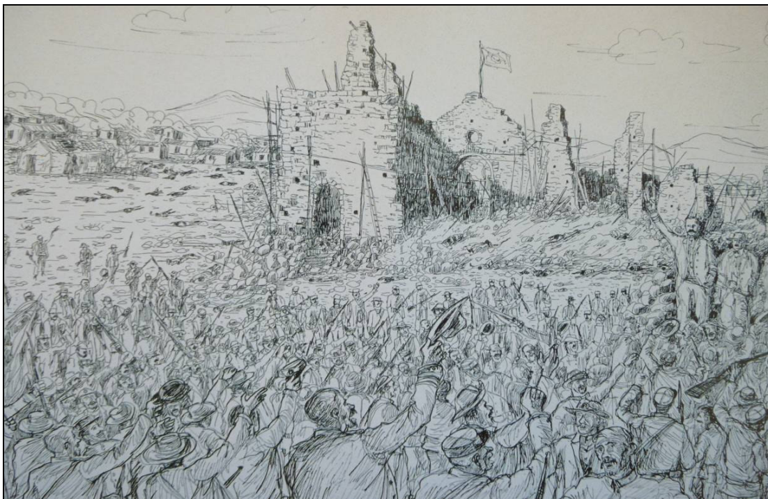
(Imagem 04). Canudos e Igreja Nova arrasados

No dia 5 de outubro de 1897, quando do assalto final, o arraial todo ardia como fornalha. Canudos encontrava-se demolida. A igreja fortaleza em cujas torres incompletas e andaimes transitavam os sertanejos para acertar os inimigos, e que por sua vez consistia no alvo preferencial da fuzilaria dos soldados caiu, enfim, no finzinho da guerra, havendo grande manifestação de júbilo entre os soldados. Aproximava-se o desfecho da bizarra guerra que teve, por centro, essa igreja. (Imagem 08).