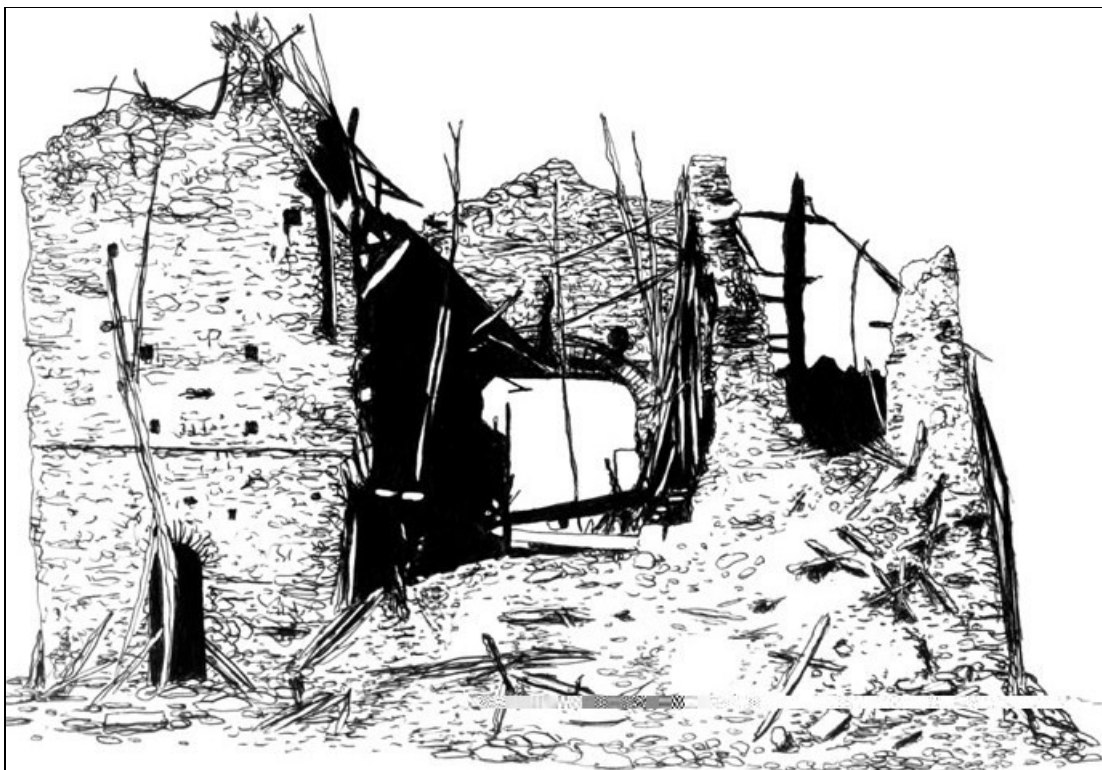
Imagem 01: Igreja do Bom Jesus ou Igreja Nova – Belo Monte

Autoria: Antônio Conselheiro, século XIX.