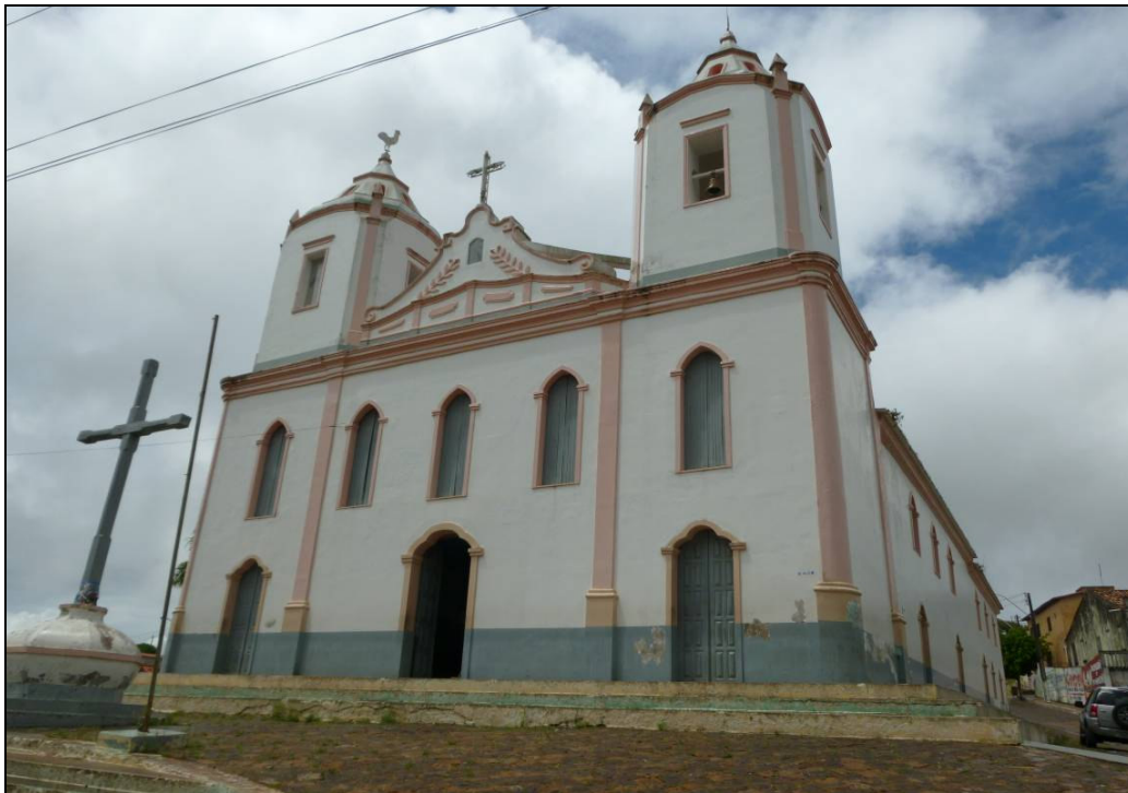
(Imagem 06) Igreja de Nossa Senhora do Bom Conselho, Cícero Dantas - BA

Autoria: Apôlonio de Todi, século XVIII.